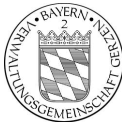
Klaus Hoffmeister Verwaltungsrat

Im Internet veröffentlicht am: 10.09.2018 Veröffentlichung im Bürgerblatt Ausgabe: