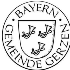
Maximilian Graf von Montgelas 1. Bürgermeister