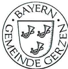
Maximilian Graf von Montgelas 1. Bürgermeister