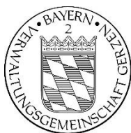
Konrad Hartshauser 1. Bürgermeister

Verwaltungsgemeinschaft Gerzen Gerzen, 08.01.2024