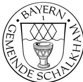
Lorenz Fuchs 1. Bürgermeister